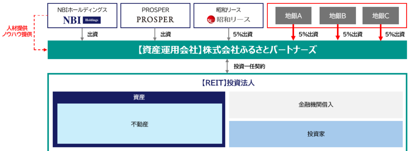
スキーム図（REIT 運用開始時）

「ふるさとパートナーズ」は、地方の観光活性化をコンセプトとした REIT を組成し、地域やエリアの長期的な価値創出を可能にするプラットフォームとして、全国の地域金融機関の皆さまと協働していく仕組みを構築してまいります。具体的には、資産運用会社である「ふるさとパートナーズ」に対して地域金融機関からの出資を受け入れ、各地域金融機関は自らのエリアの地域活性化や地方創生を「ふるさとパートナーズ」と共に実現していくことが可能となります。